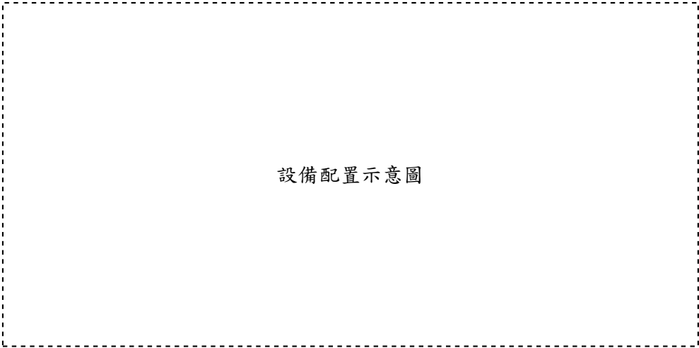
附圖一、設備配置示意圖